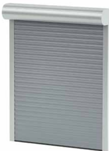
BGR / SKO-P