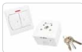
Переключатель кнопочный и кнопка-ключ