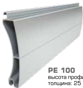
PE 100 высота профиля: 100 mm толщина: 25 mm

Алюминиевые профили экструдированные, типа: