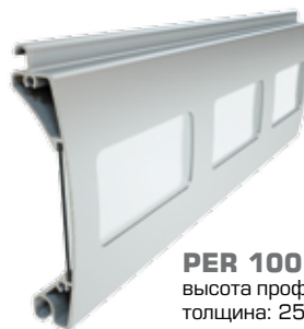
PER 100 высота профиля: 100 mm толщина: 25 mm

Дополнительные профили к решеткам, типа: