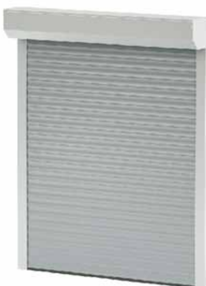
BGR / SK