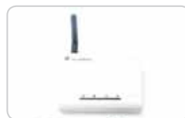
Интеллектуальная система управления