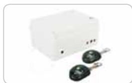
Центральное радиоуправление с пультами