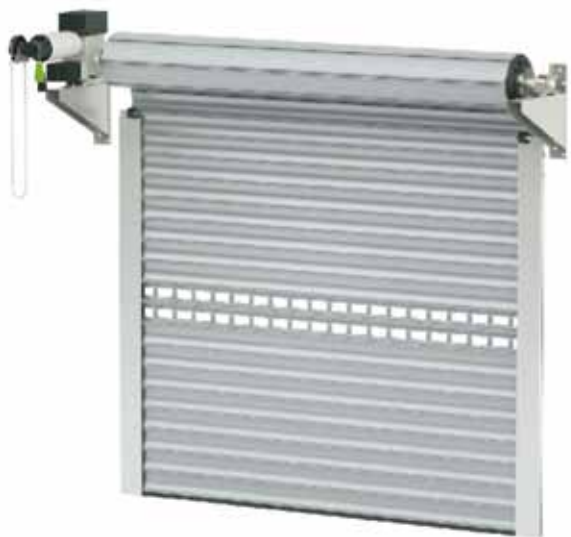
BPR / KNS